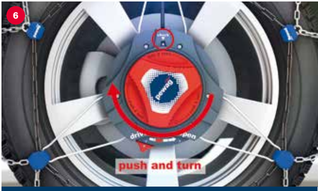
Mounting pevag servomatik