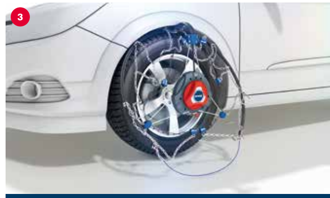
Mounting pevag servomatik